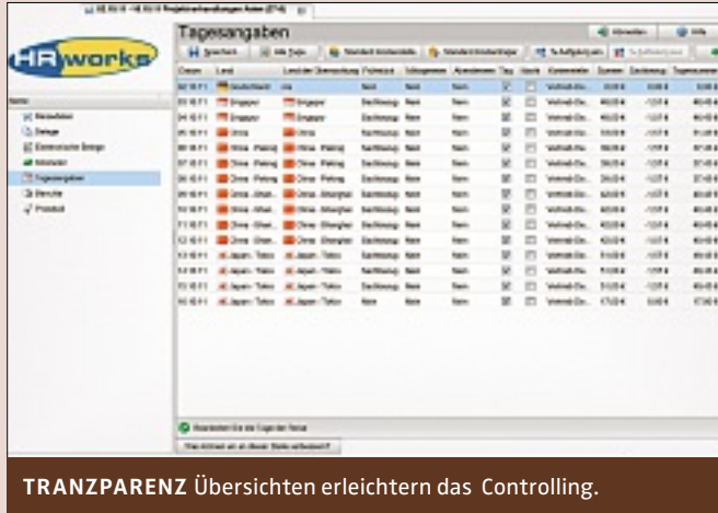
TRANSPARENZ Übersichten erleichtern das Controlling.