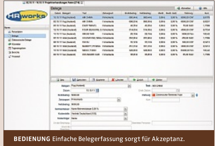
BEDIENUNG Einfache Belegfassung sorgt für Akzeptanz.

„Die Akzeptanz ist nach der ersten Schrecksekunde hoch.“